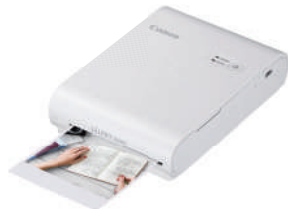
Canon SELPHY SQUARE QX10(WH)