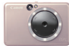
Canon iNSPiC ZV-223 (ピンク)